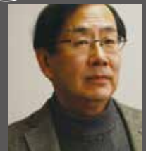
「東アジア文化都市 2017 京都」アジア回廊現代美術展 アーティスト・ディレクター 京都芸術センター館長・多摩美術大学学長 建島 哲

京都市生まれ。早稲田大学卒業。国立国際美術館館長。京都市立芸術大学学長を経て 2011 年〜埼玉県立近代美術館館長。2016 年〜多摩美術大学学長。2017 年〜京都芸術センター館長。「ヴェネチア・ビエンナーレ」[横浜トリエンナーレ 2001]、「あいちトリエンナーレ 2010」など、多くの国際美術展を組織し、アジアの近現代美術の企画にも多数参加。